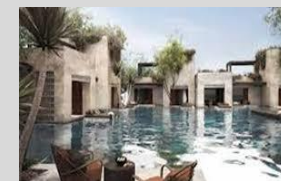
Achaia 50 Keys 4* Waterfront hotel