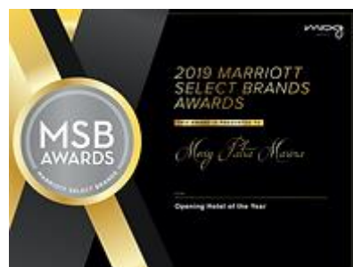
Βραβείο 'Best Hotel Opening' Marriott International

Η CS Hospitality παρέχει υπηρεσίες λειτουργικής διαχείρισης για το ξενοδοχείο σας, διασφαλίζοντας τη σύγχρονη και ομαλή λειτουργία του, εποπτεύοντας κάθε παράρτημα, αναλαμβάνοντας την πρόσληψη και εκπαίδευση του προσωπικού, επιτυγχάνοντας τη μείωση των πάγιων εξόδων και εφαρμόζοντας ένα σύστημα ποιοτικής διαχείρισης.