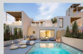
Aura Villas - Tinos (May 2023)