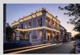
The Bold Type – Patras 5* Member of Design Hotels