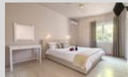
Paradise Village 26 keys - Corfu Owned property