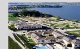
Du Lac Ioannina 170 keys 5* Epirus