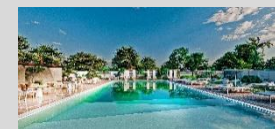
Hidden Cove – Corfu 20 keys 4* Resort