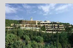
The Kassiope project 166 Keys 5* Corfu