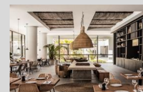
Cyclades 45 Keys 5* Boutique resort