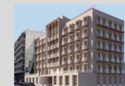
Moxy Patra Marina 116 Keys 3* Patras