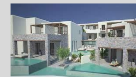
Bard de Sol - Mykonos 4* Lifestyle Resort