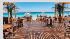
Paphos Cyprus (MI) 120 Keys 5*