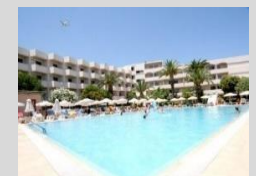
Ialysos Bay - Rhodes 232 keys 4* Resort Owned property