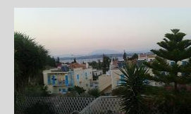
Metaxa Suites Spetses 18 keys island escape