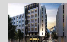
Academias of Athens 60 keys 5*