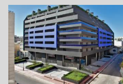
Pharos Residence 85 keys – Piraeus