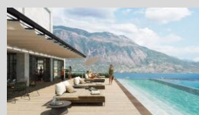
Boutique hotel Kalamata 99 Keys 5*