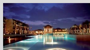
Hotel Nikopolis 99 keys 5* Thessaloniki