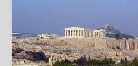
5* Boutique Hotel - Athens 18 keys -Acropolis