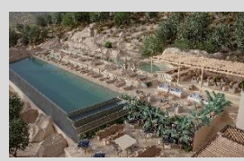
Radisson Blue Mani 150 Keys, 5* Resort