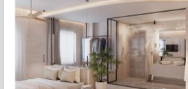
Aura Suites- Paros (April 2023)