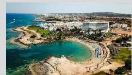
Crystal Springs - Cyprus 175 Keys 4* Resort